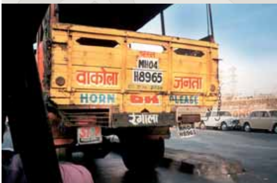
Durch Keralas Verkehr zum Touristenelefanten.

Ich nickte vorsichtig. Bevor wir losfahren, zeigte der Chauffeur den frischen Stempel des Gift Shops: nun hatte er sieben. Er brauchte noch drei.