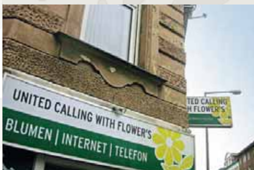
Nebenkabinengespräche: interessanter als eigene.

LOGBUCH WELT, 52 Reiseziele, www.amanshauser.at , Bestell-Info unter www.diepresse.com/amanshauser oder 01/51414-555.